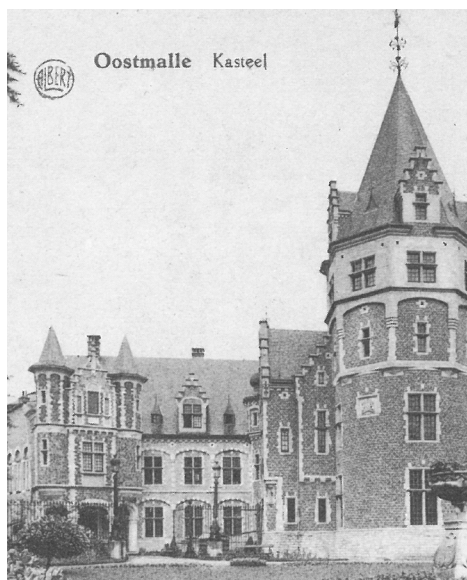
Oude postkaart van kasteel de Renesse.