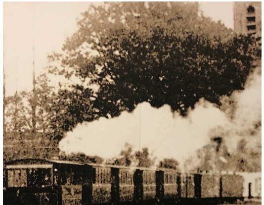
De stoomtram rijdt door het centrum van Oostmalle.

Wandel de straat uit tot je opnieuw aan de Antwerpsesteenweg komt. Steek over via het zebepad, en vervolg je weg rechtdoor. Wanneer je niet meer verder kan, sla je linksaf. Je wandelt nu op Den Akker.