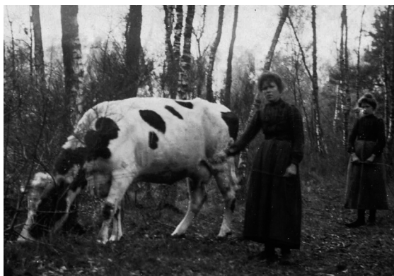
De koeien worden getuierd in Witbos.

We hopen dat je genoten hebt van deze wandeling over trage wegen.